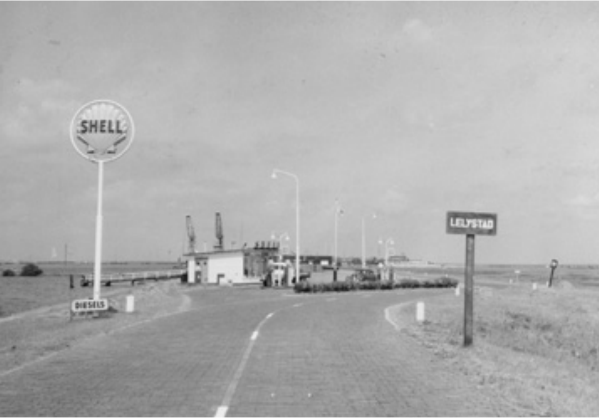
Benzine laadstation bij de entree van het tijdelijke Lelystad, Oostelijk Flevoland, 1961